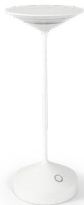
Tempo Bianco Tempo, white