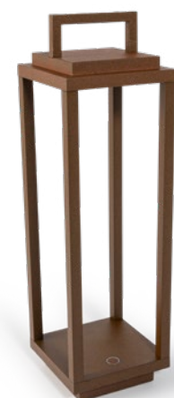
Resort Corten Resort, corten