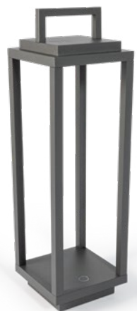
Resort Grigio scuro Resort, dark grey