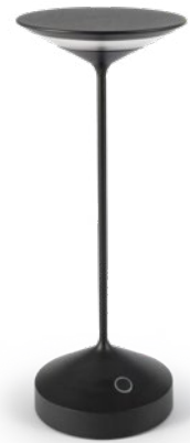
Tempo Antracite Tempo, anthracite