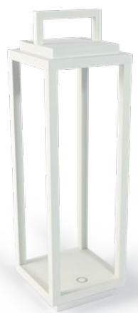
Resort Bianco Resort, white