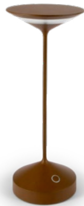
Tempo Corten Tempo, corten